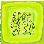
compil Rue Sans Hairé

Aujourd'hui, le groupe se met en quête de labels, tourneurs et toutes personnes susceptibles de donner une chance à la musique d'Evergreen Terrasse de se faire entendre du plus grand nombre.